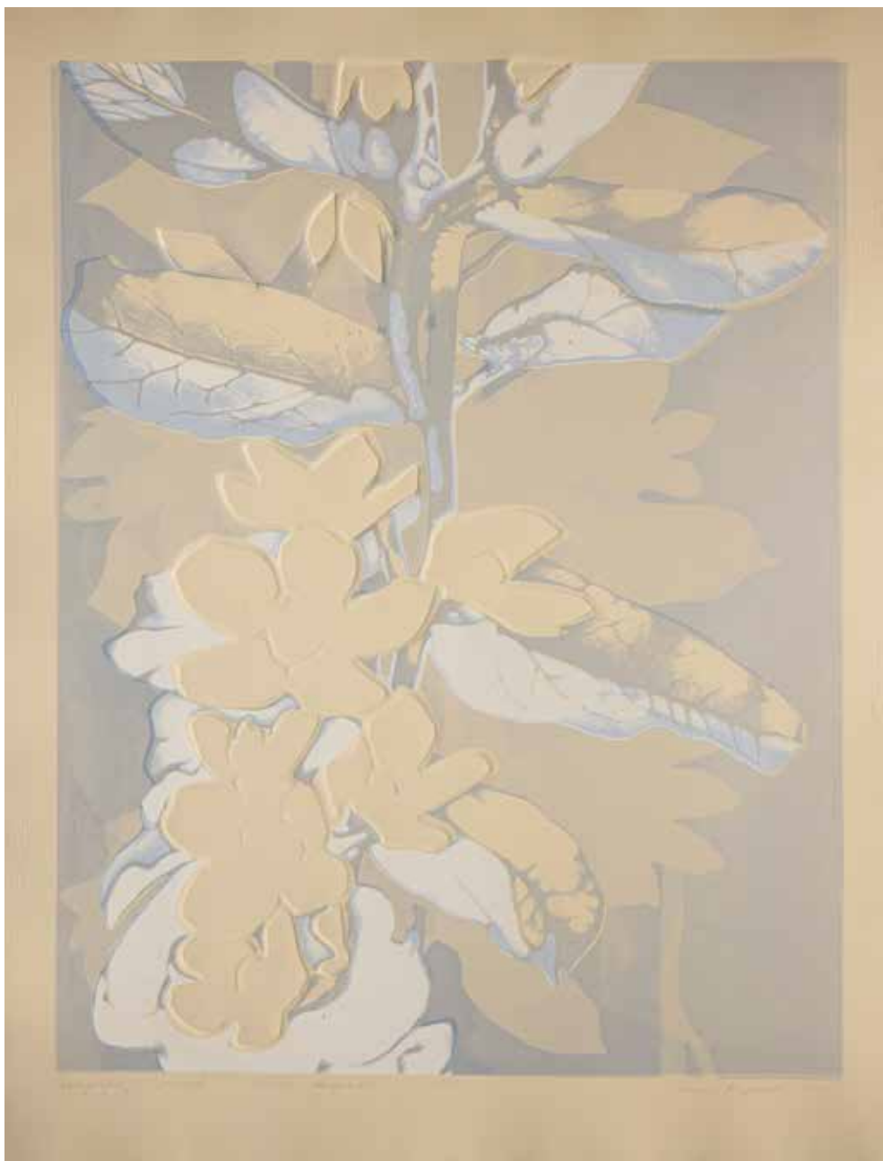
2020, Ulotna doskonałość , z cyklu Ulotna doskonałość , serigrafia i linoryt, 66 x 50 cm