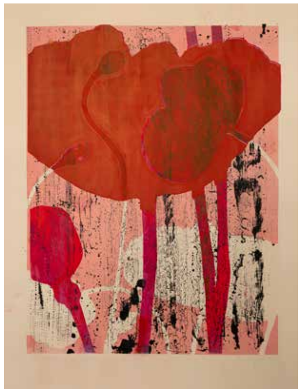
2022, Wypełnienie , serigrafia, 66 x 50 cm