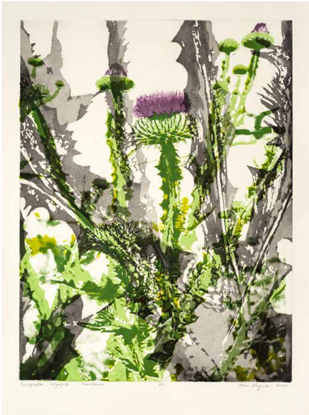
2019, Przemijanie , serigrafia i odprysk, 66 x 50 cm