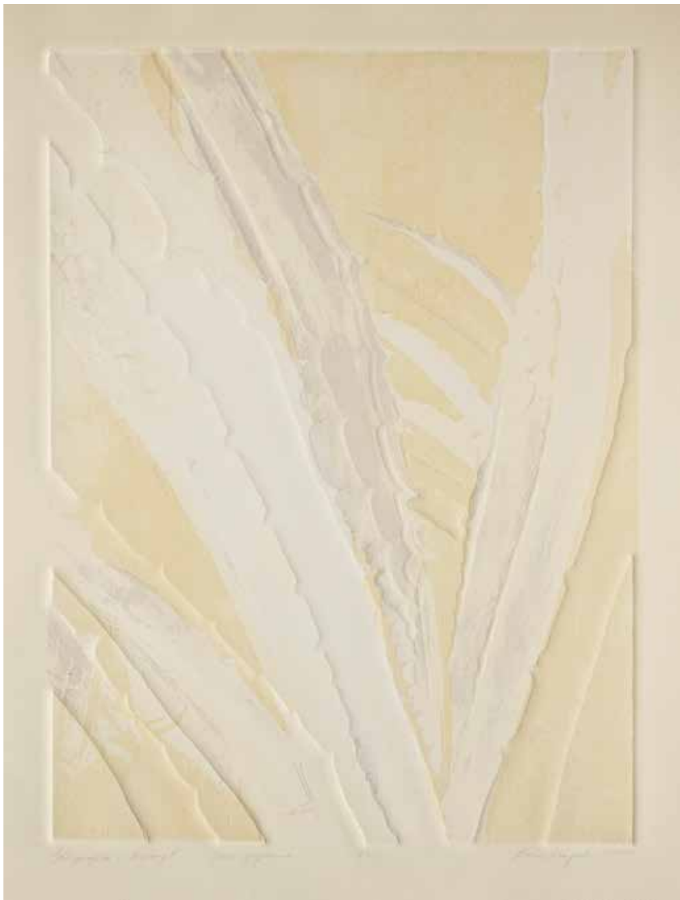
2020, Inne spojrzenie , serigrafia i linoryt, 66 x 50 cm