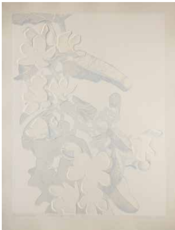
2020, Ulotna doskonałość , z cyklu Ulotna doskonałość , serigrafia i linoryt, 66 x 50 cm