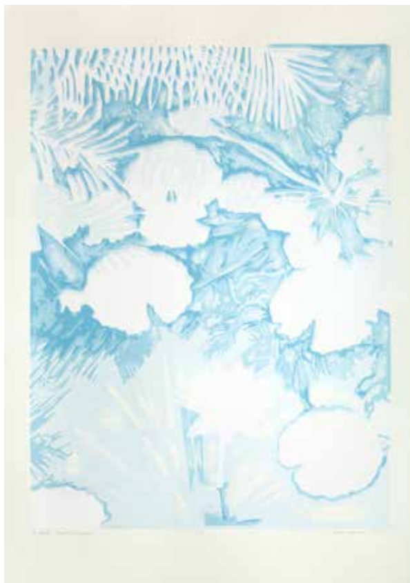
2018, z cyklu Fantasmagoria , serigrafia, 66 x 50 cm