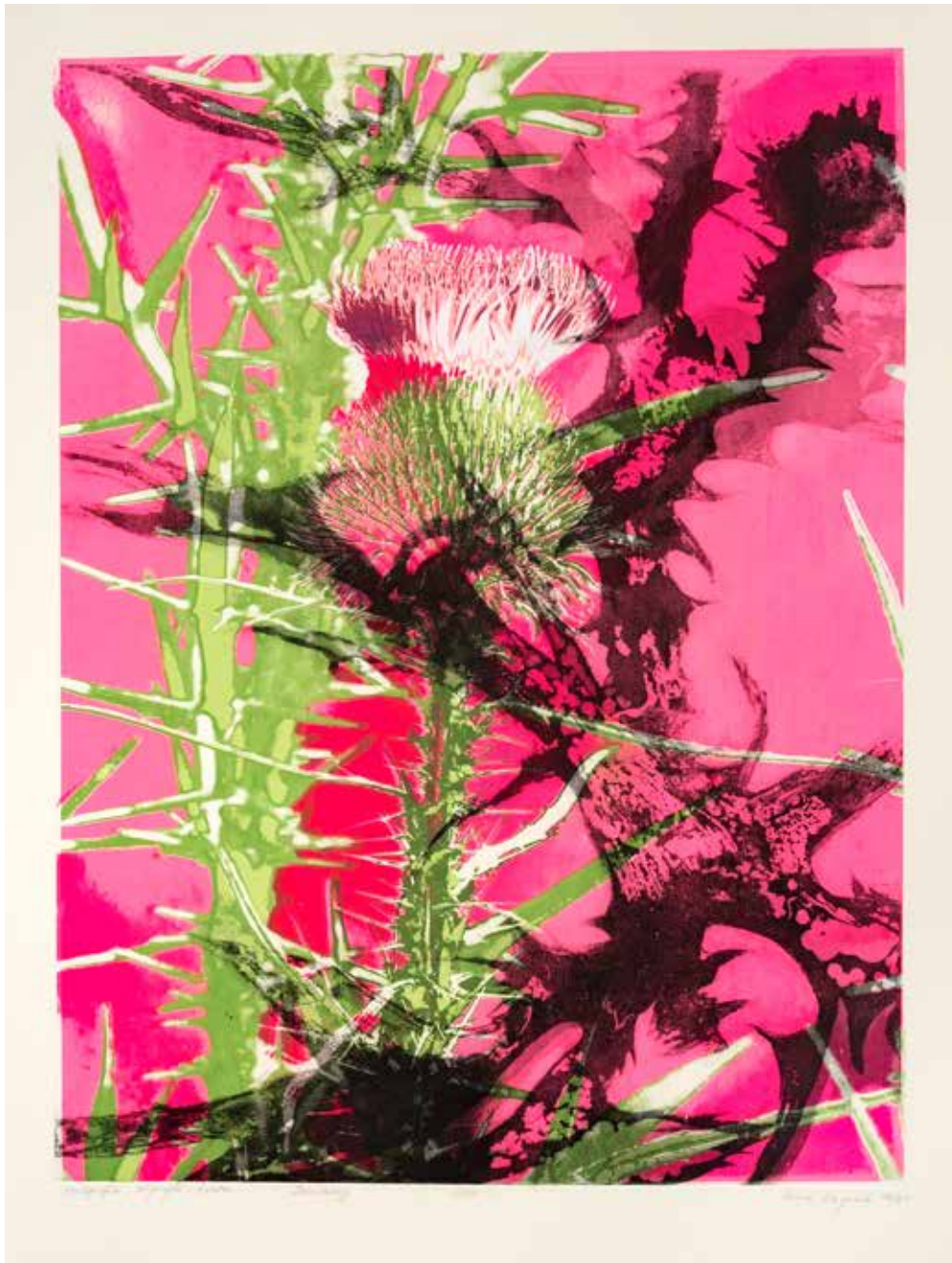
2019, Zmiany , serigrafia i odprysk, 66 x 50 cm