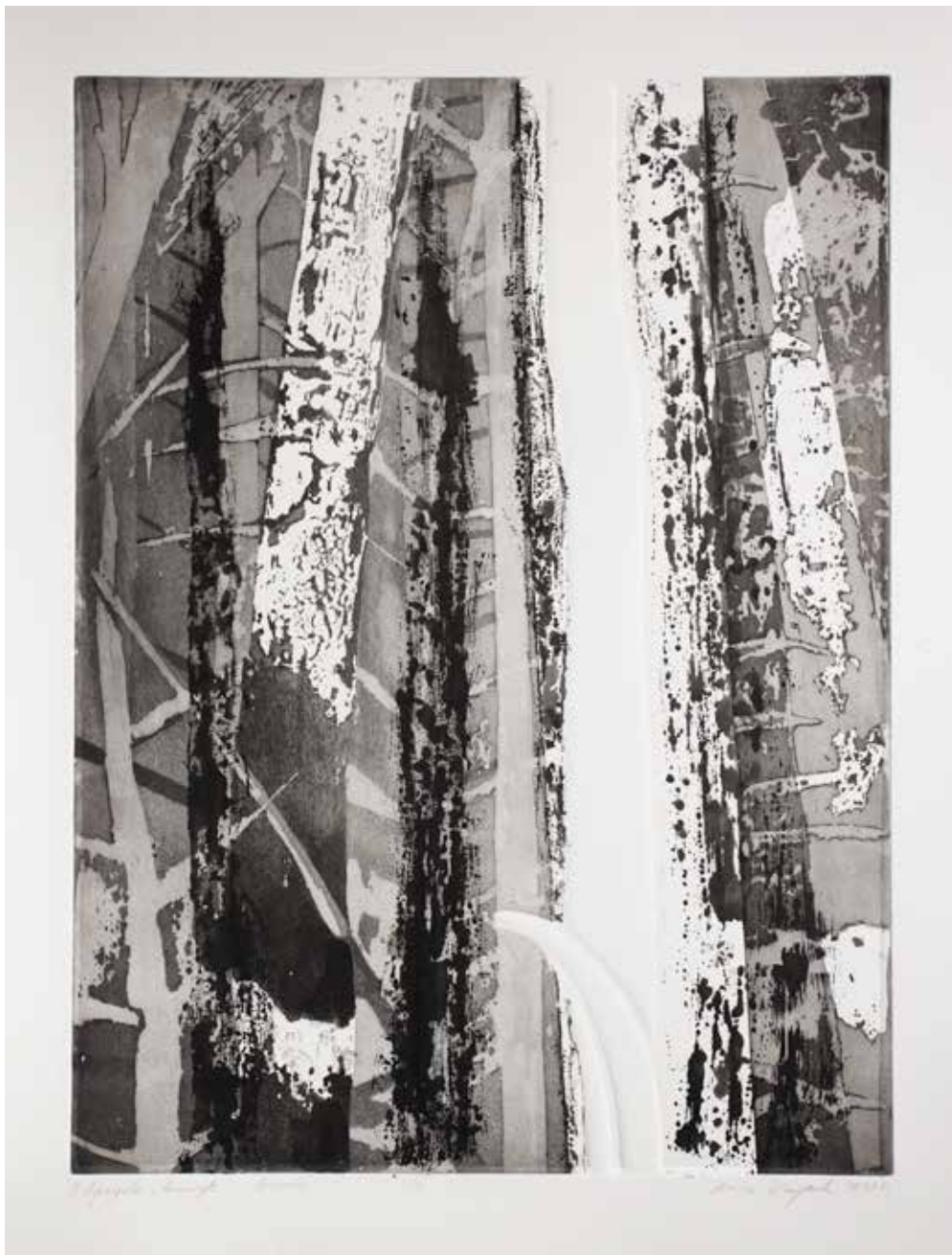
2020, Inność , serigrafia, odprysk i linoryt, 66 x 50 cm