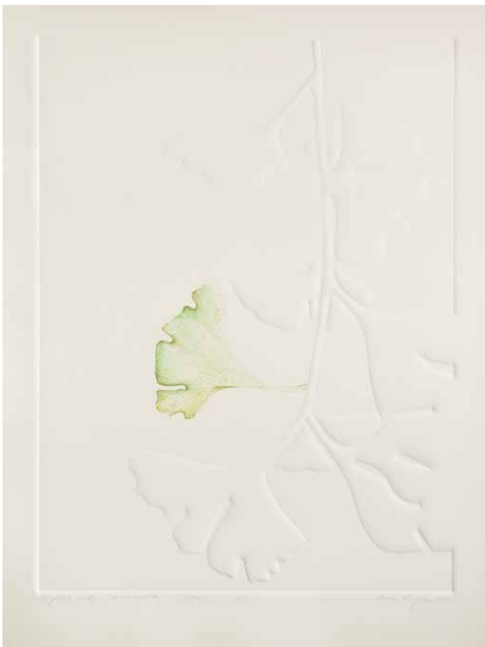
2020, Unique , akwarela i linoryt, 66 x 50 cm