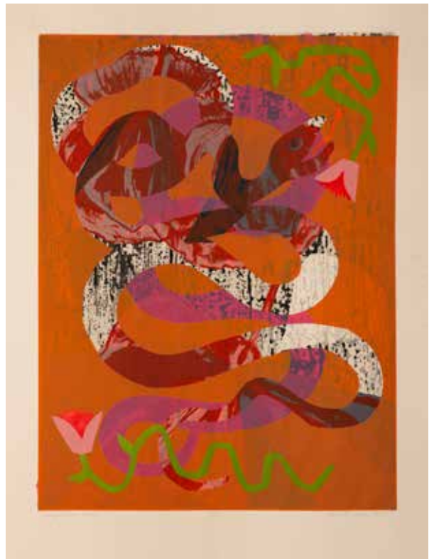
2023, Raj , serigrafia, 66 x 50 cm