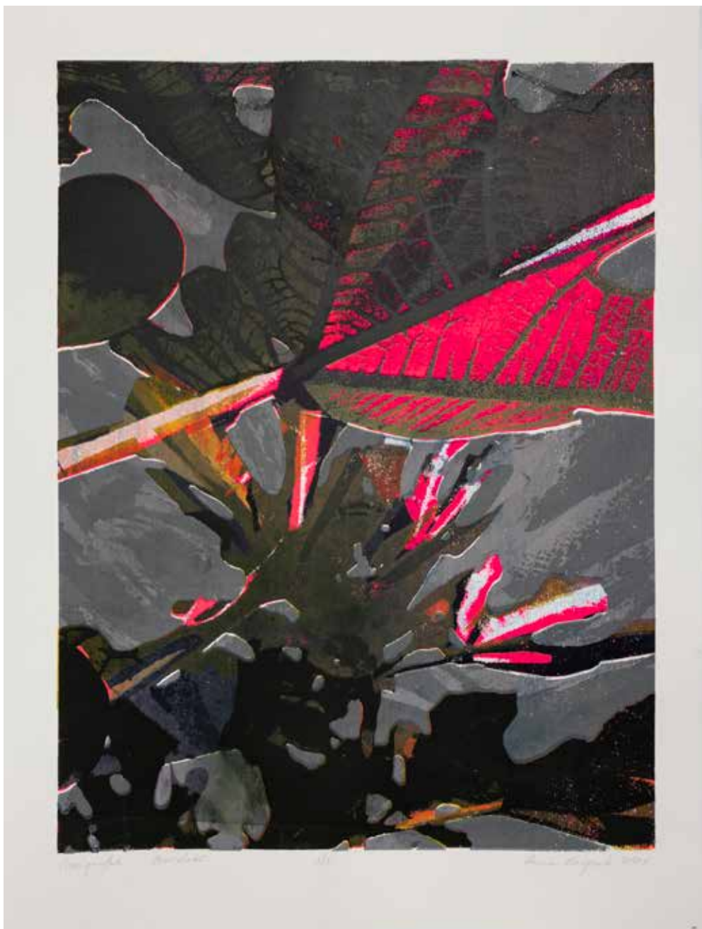
2020, Powidoki , serigrafia, 66 x 50 cm