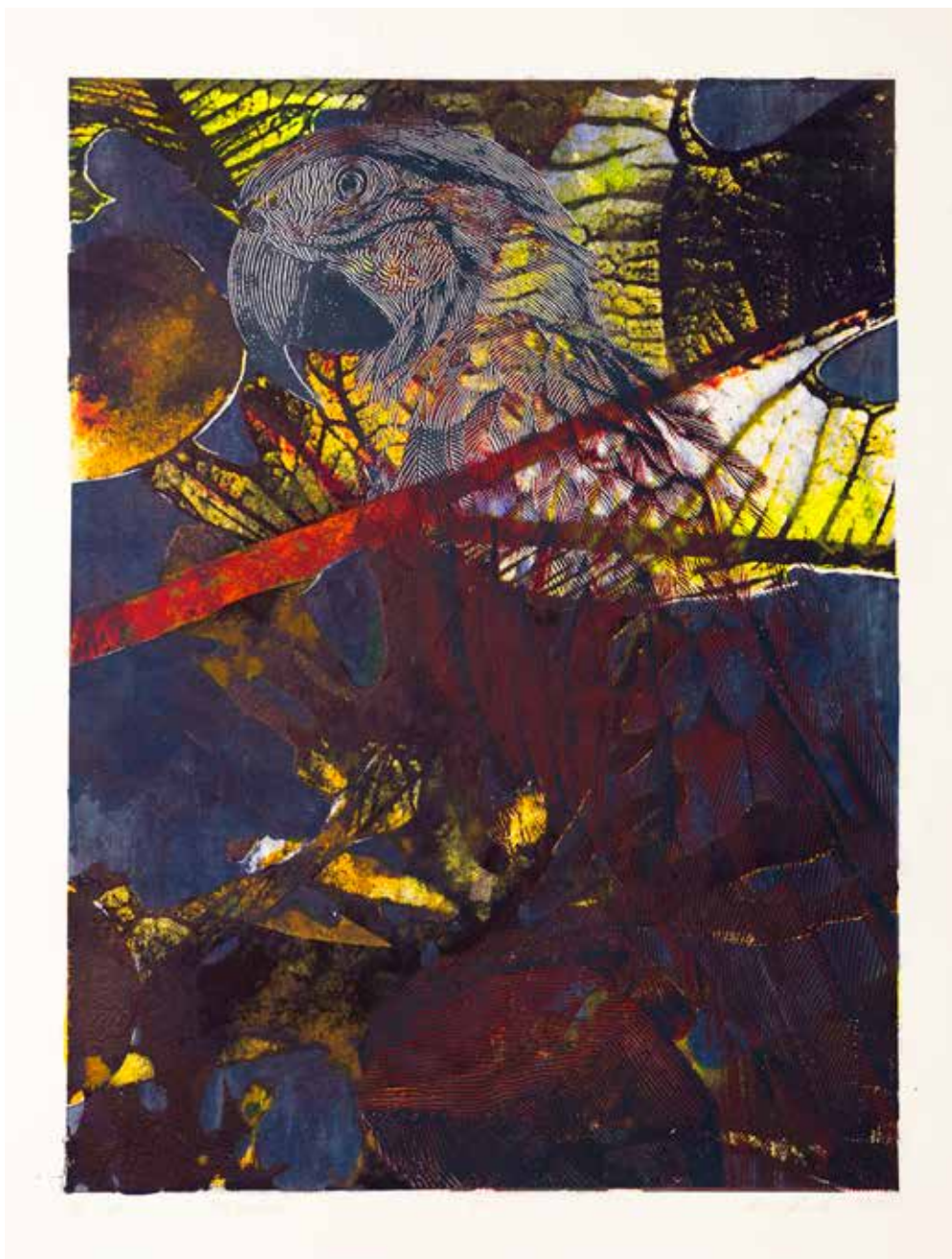
2022, U celu , serigrafia, 66 x 50 cm