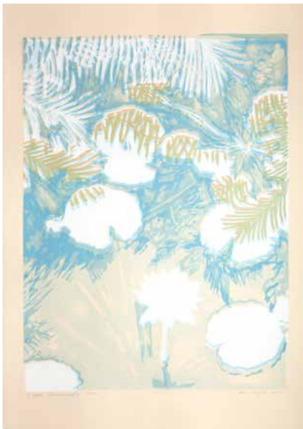
2018, Miraż , z cyklu Fantasmagoria , serigrafia, 66 x 50 cm