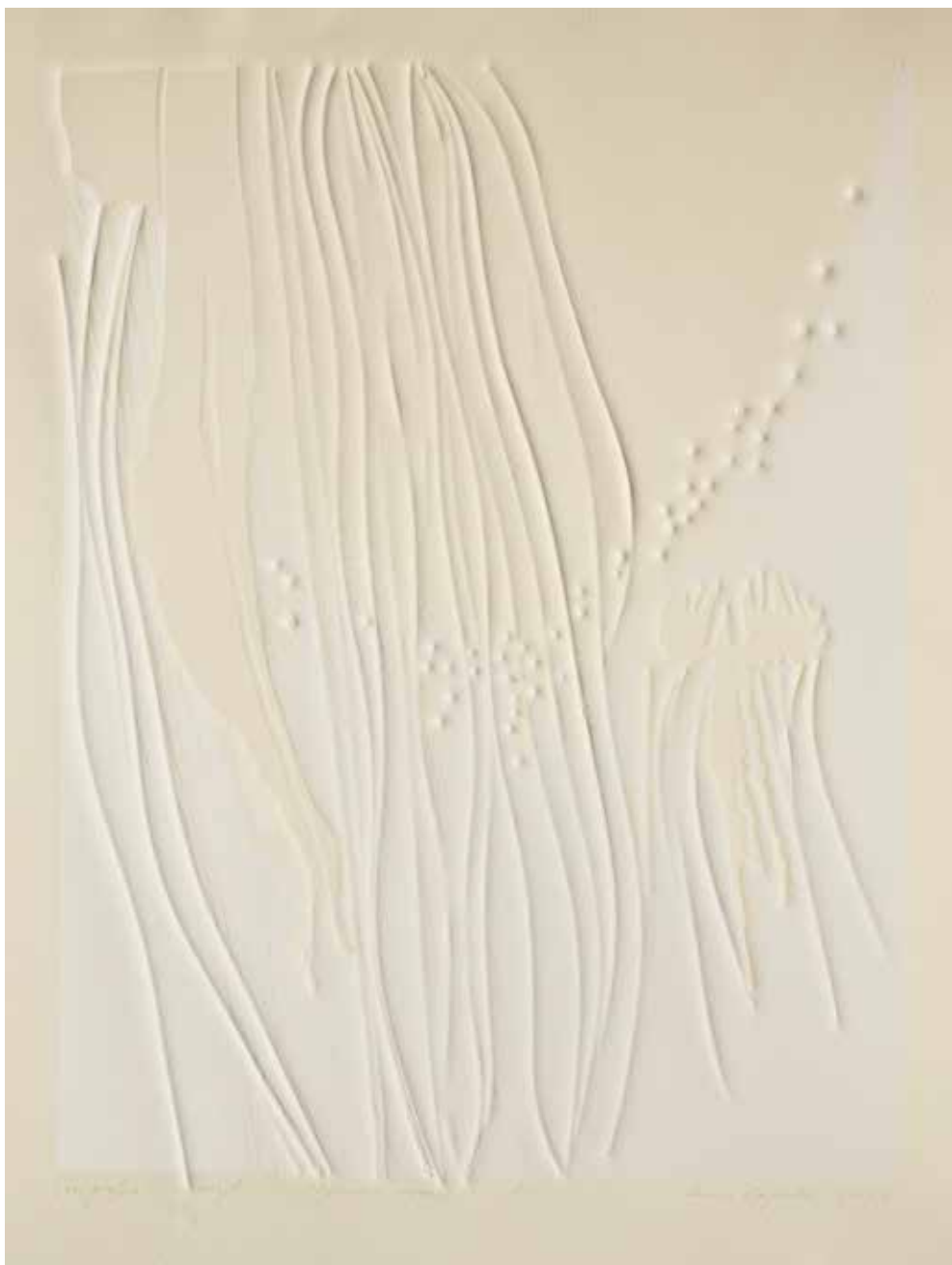
2020, Płynność czasu 2 , serigrafia i linoryt, 66 x 50 cm