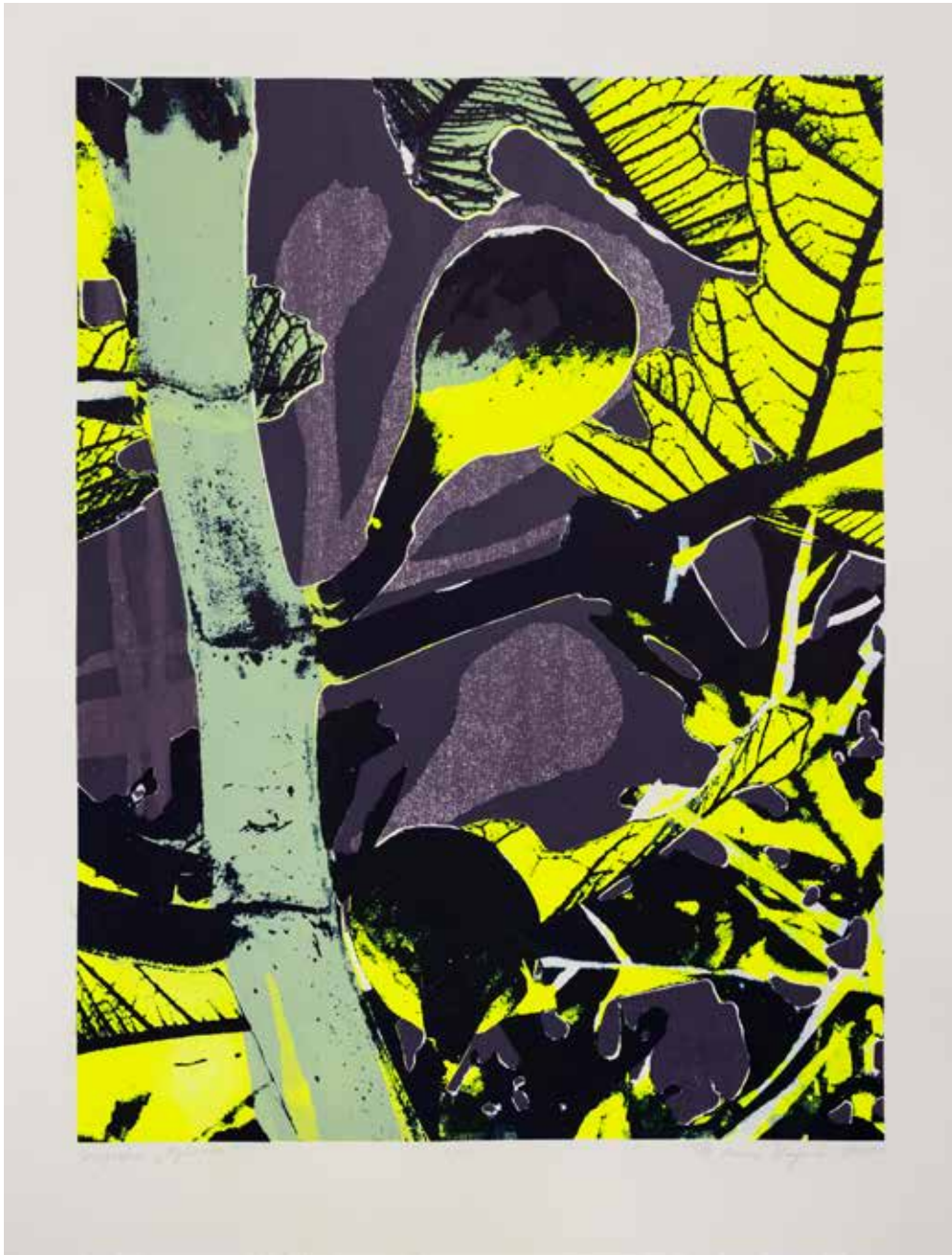
2020, Wybrana , serigrafia, 66 x 50 cm