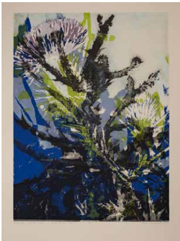
2019, Nawarstwianie czau , serigrafia i odprysk, 66 x 50 cm