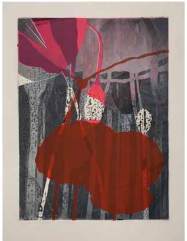
2021, Istota życia , odprysk i serigrafia, 66 x 50 cm