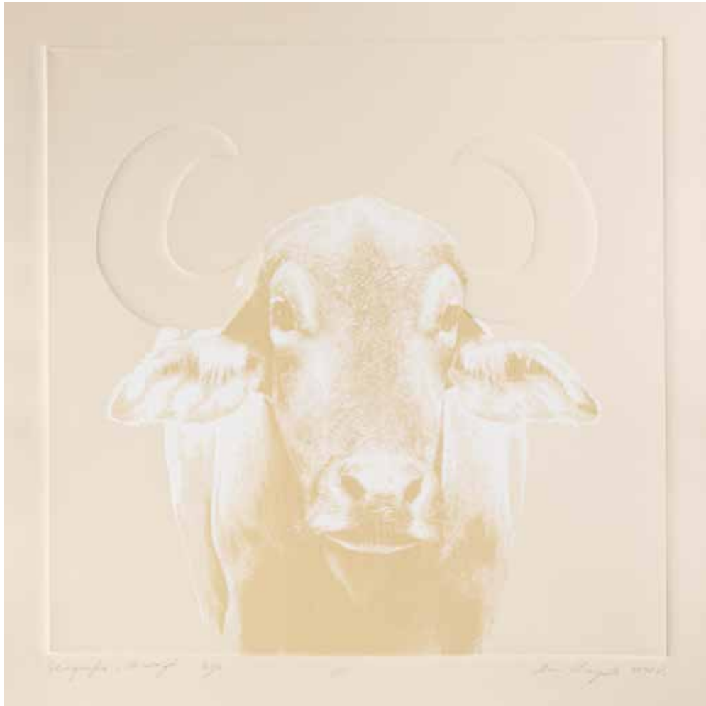
2020, Byk , linoryt i serigrafia, 50 x 50 cm