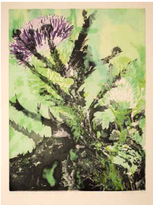
2019, Nawarstwianie czasu , serigrafia i odprysk, 66 x 50 cm