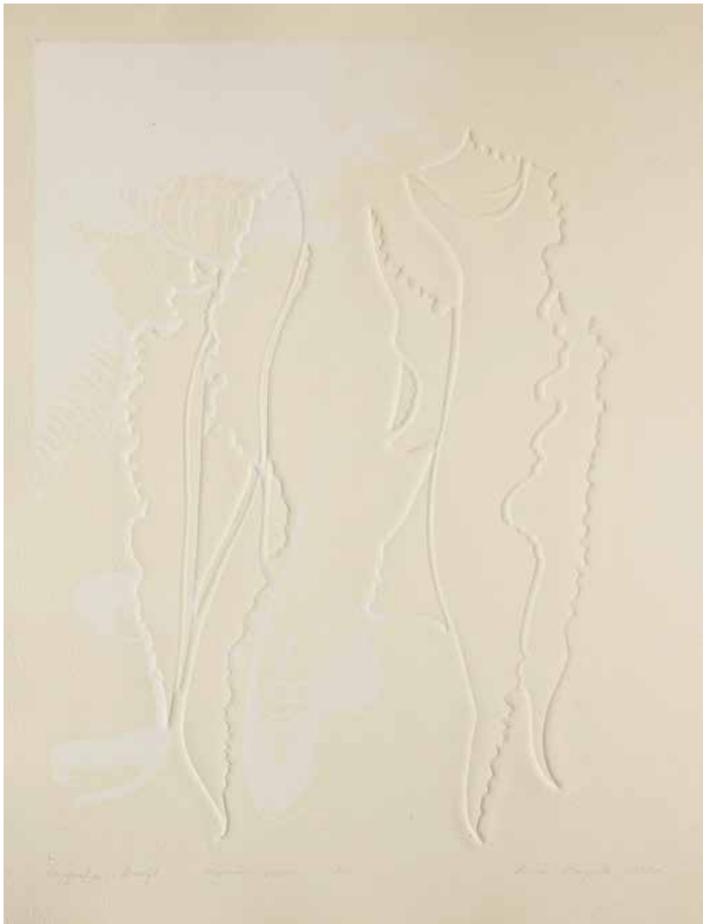
2020, Płynność czasu , serigrafia i linoryt, 66 x 50 cm