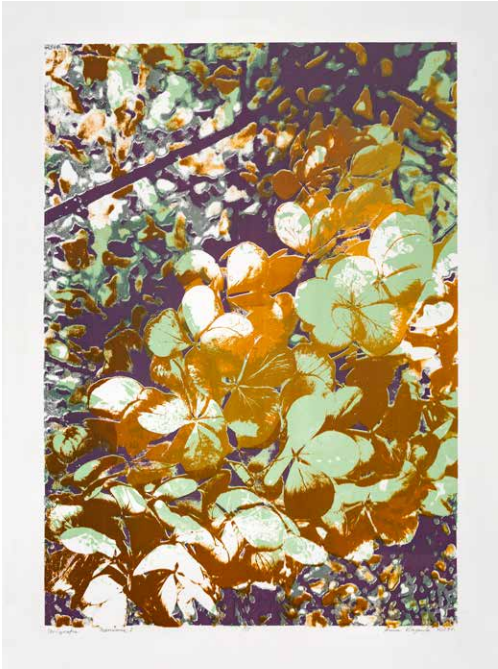
2019, Przemiana 1 , serigrafia, 66 x 50 cm