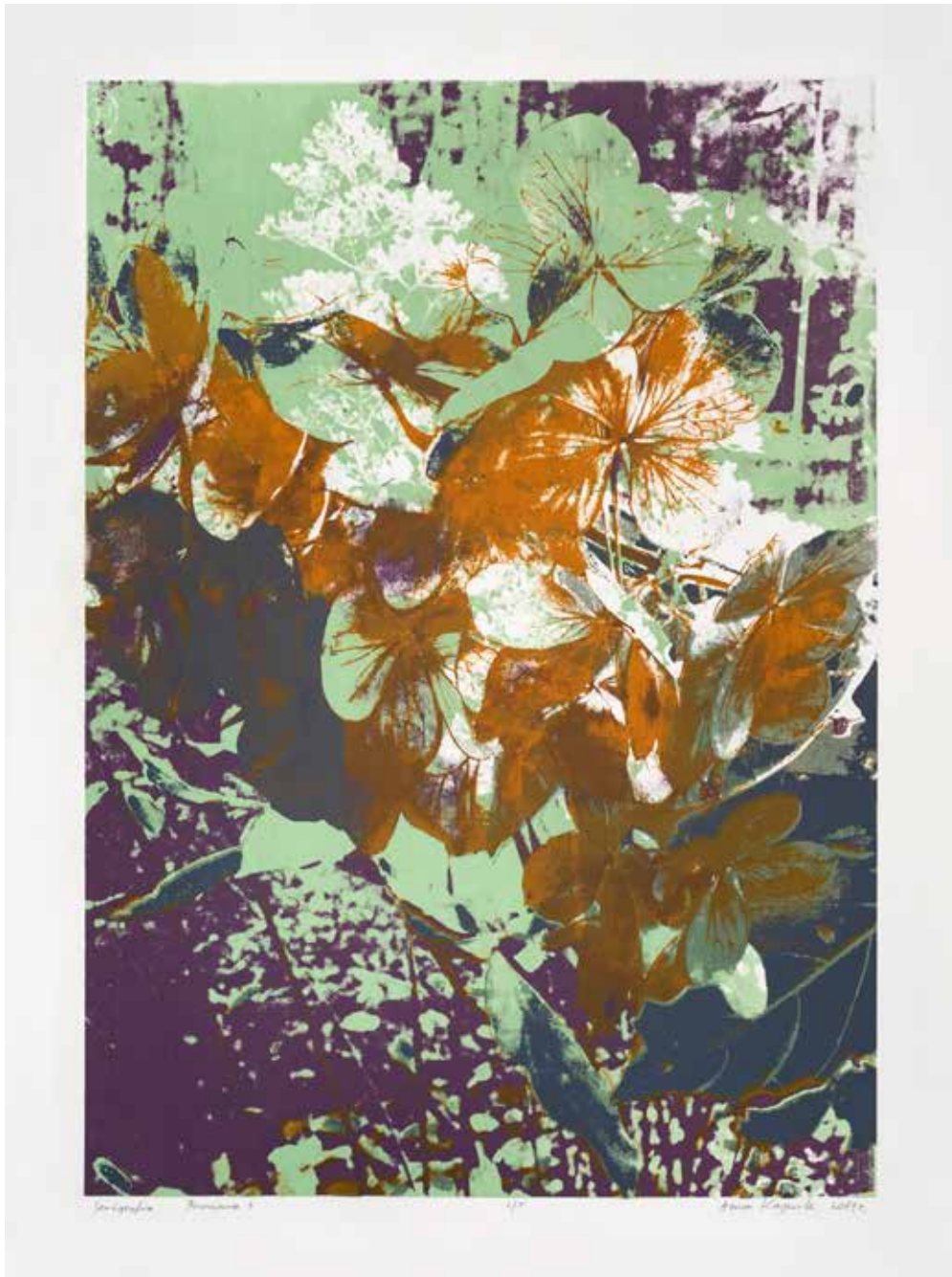
2019, Przemiana 3, serigrafia, 66 x 50 cm