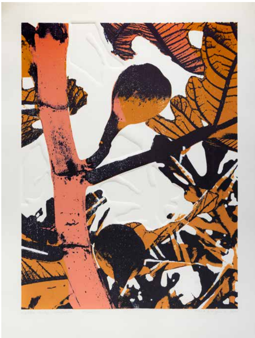
2020, Wybrana , serigrafia, 66 x 50 cm