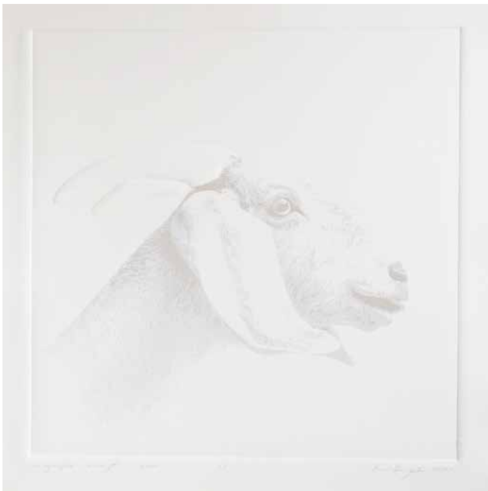
2020, Koza , linoryt i serigrafia, 50 x 50 cm