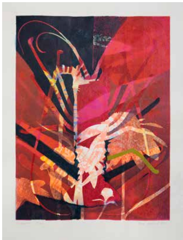
2021, Poryw , serigrafia, 66 x 50 cm