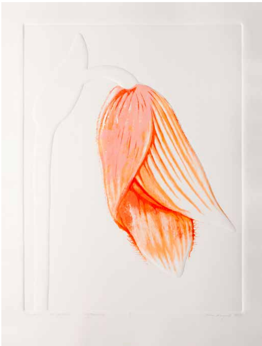
2023, Wygasanie , linoryt i serigrafia, 66 x 50 cm