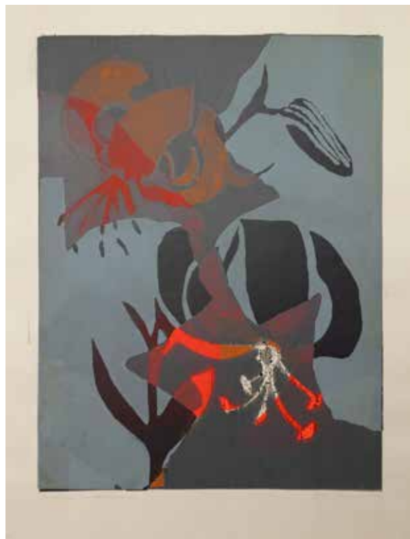
2022, Ukontowanie , serigrafia, 66 x 50 cm