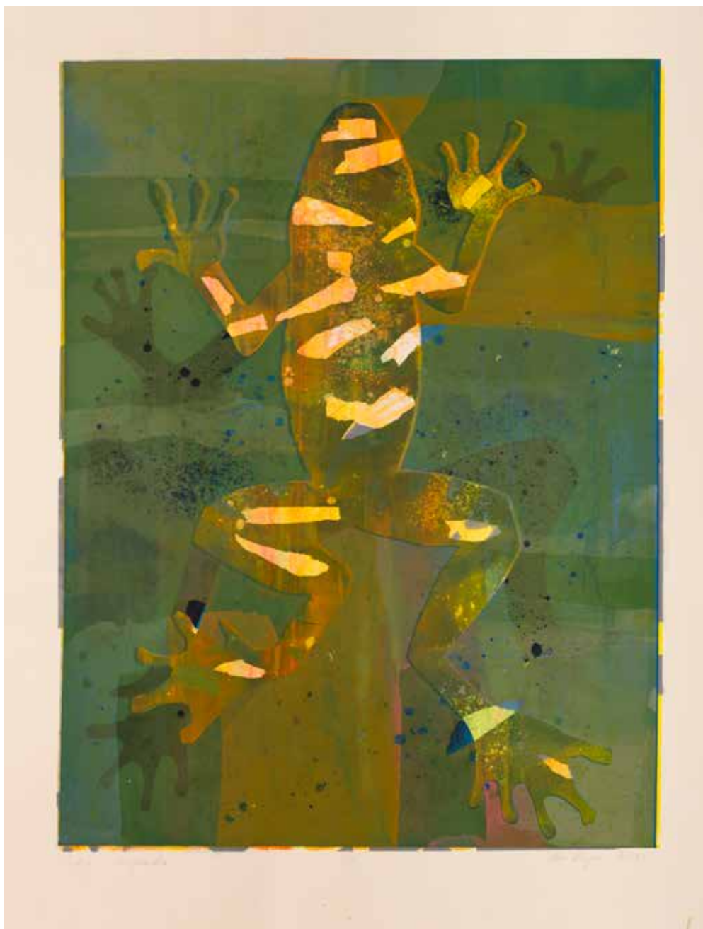
2023, Žaba , serigrafia, 66 x 50 cm