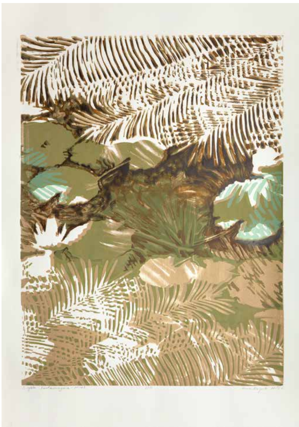
2018, Miraż , z cyklu Fantasmagoria , serigrafia, 66 x 50 cm