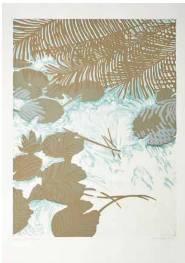
2018, Powidoki , z cyklu Fantasmagoria , serigrafia, 66 x 50 cm