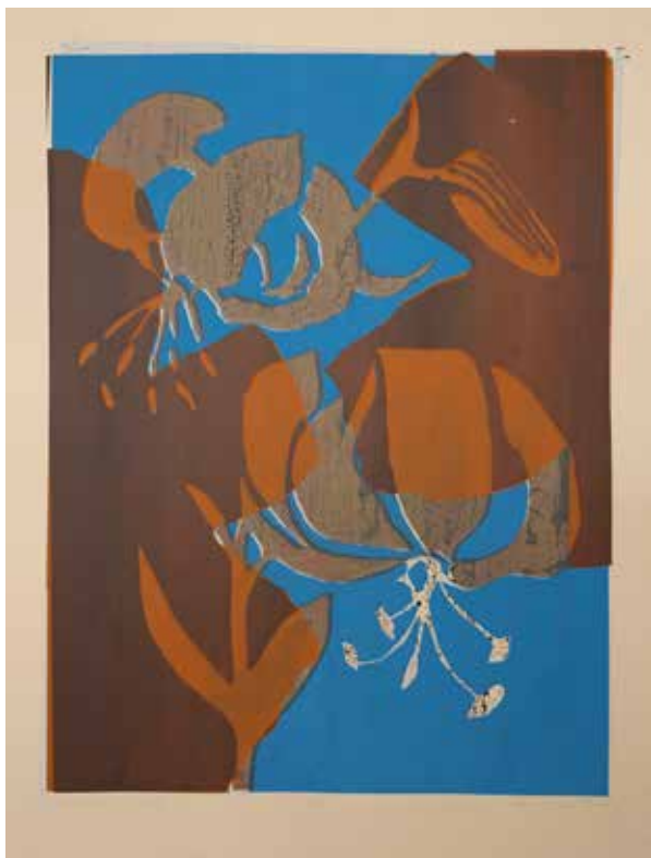
2022, Ukontowanie , serigrafia, 66 x 50 cm