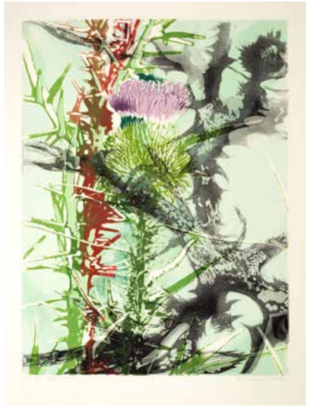
2019, Zmiany , serigrafia i odprysk, 66 x 50 cm