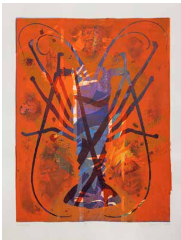
2021, Poryw , serigrafia, 66 x 50 cm