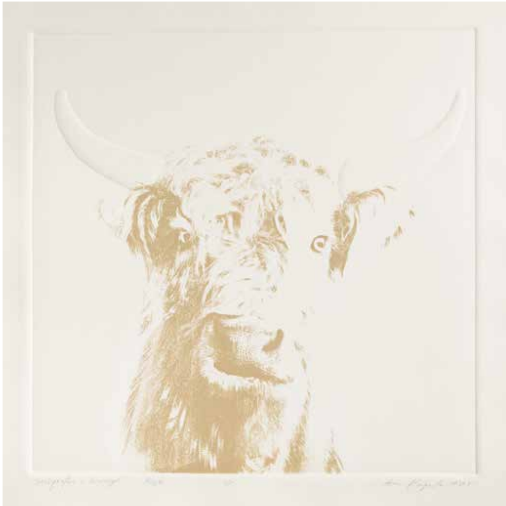
2020, Byk , linoryt i serigrafia, 50 x 50 cm