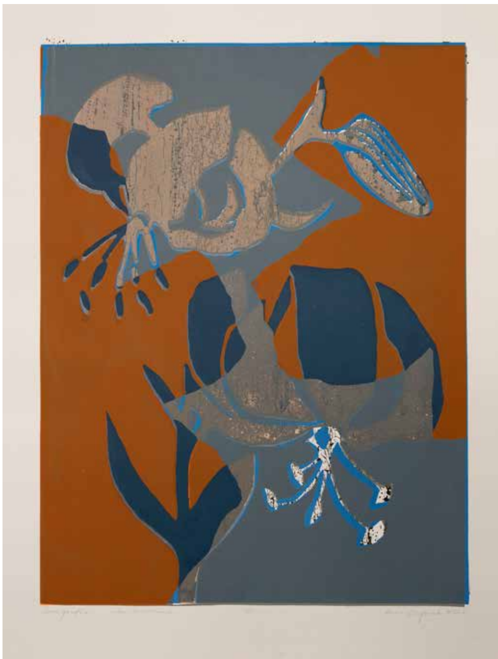
2022, Ukontentowanie , serigrafia, 66 x 50 cm