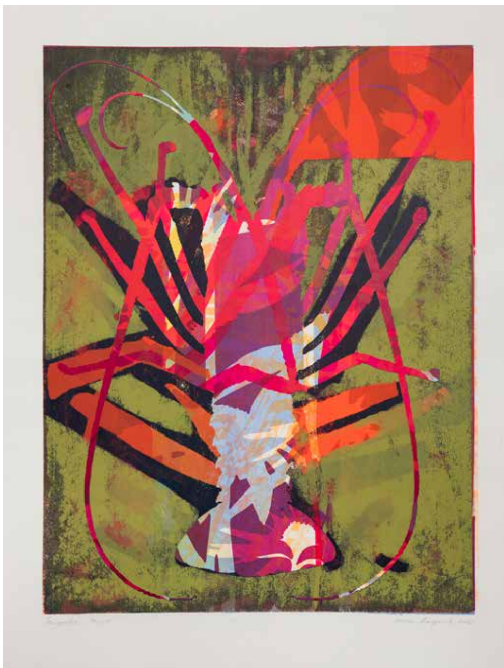
2021, Poryw , serigrafia, 66 x 50 cm