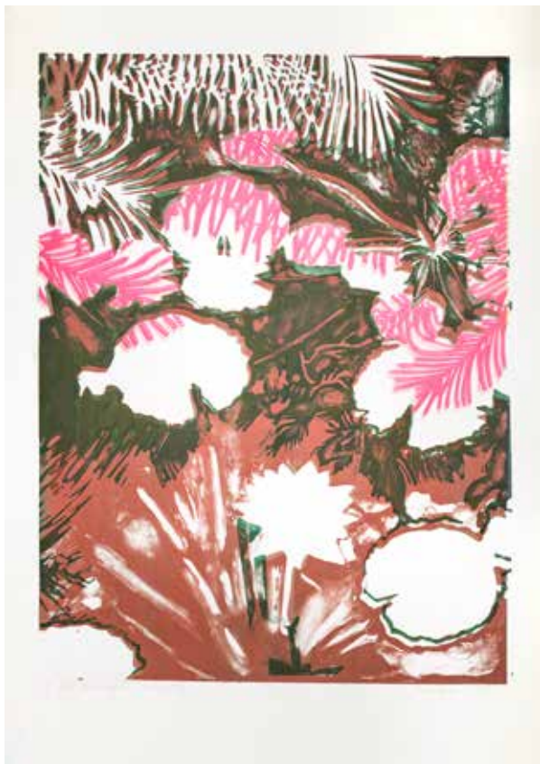
2018, Powidoki wody , z cyklu Fantasmagoria , serigrafia, 66 x 50 cm