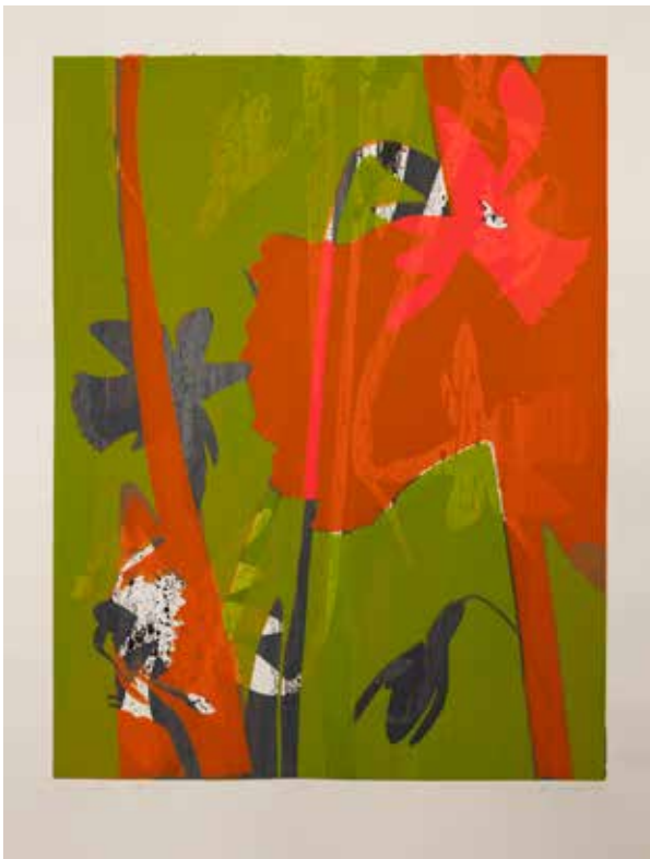
2022, Eutymia , serigrafia, 66 x 50 cm