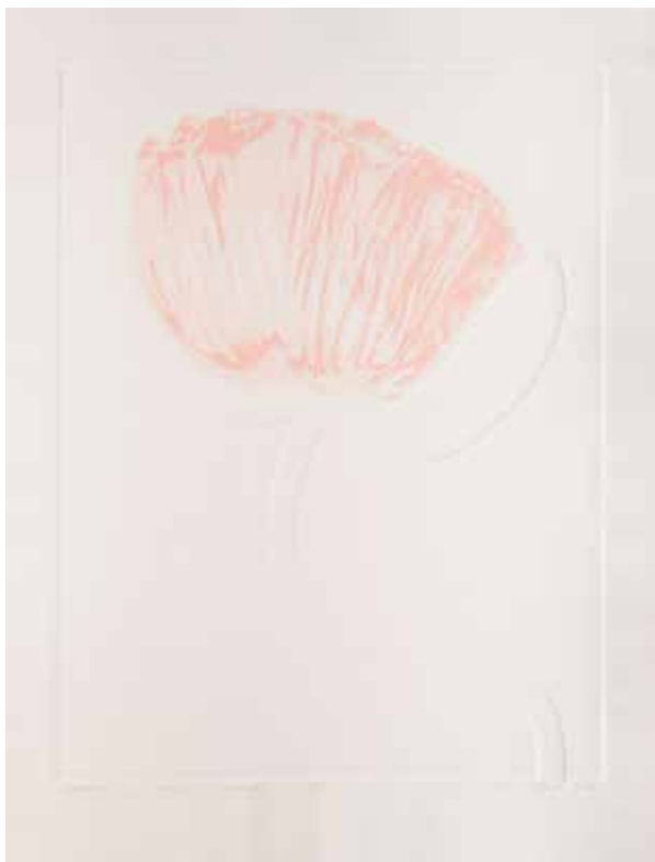
2023, Wygasanie , linoryt i serigrafia, 66 x 50 cm