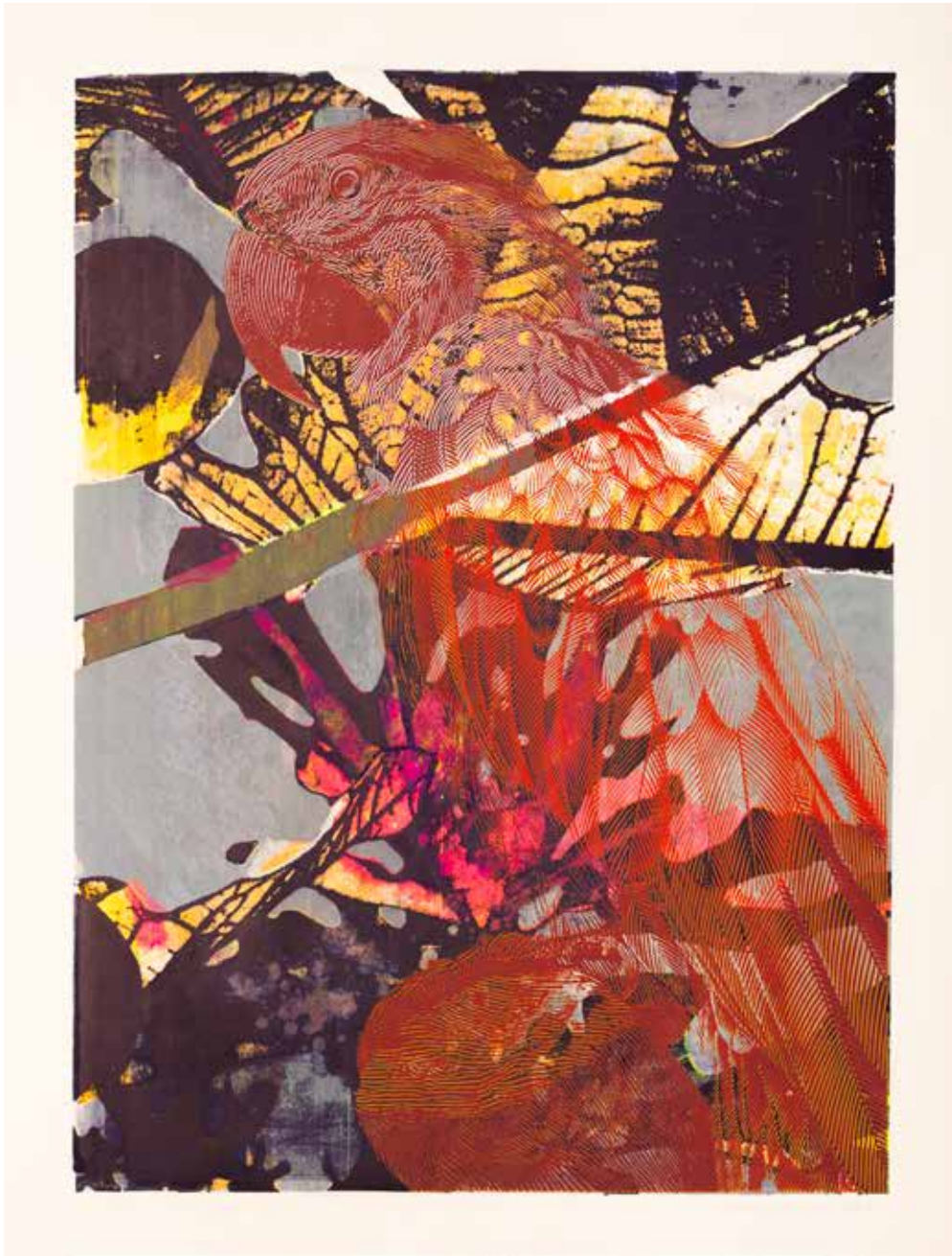
2021, U celu , serigrafia, 66 x 50 cm