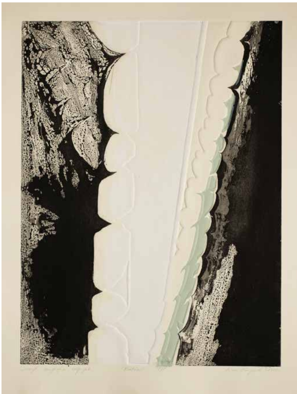
2020, Kontrast , serigrafia, odprysk i linoryt, 66 x 50 cm