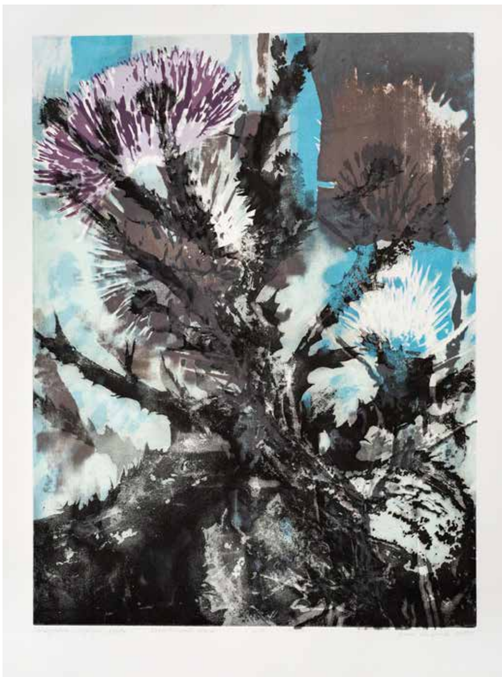
2019, Nawarstwianie czasu , serigrafia i odprysk, 66 x 50 cm