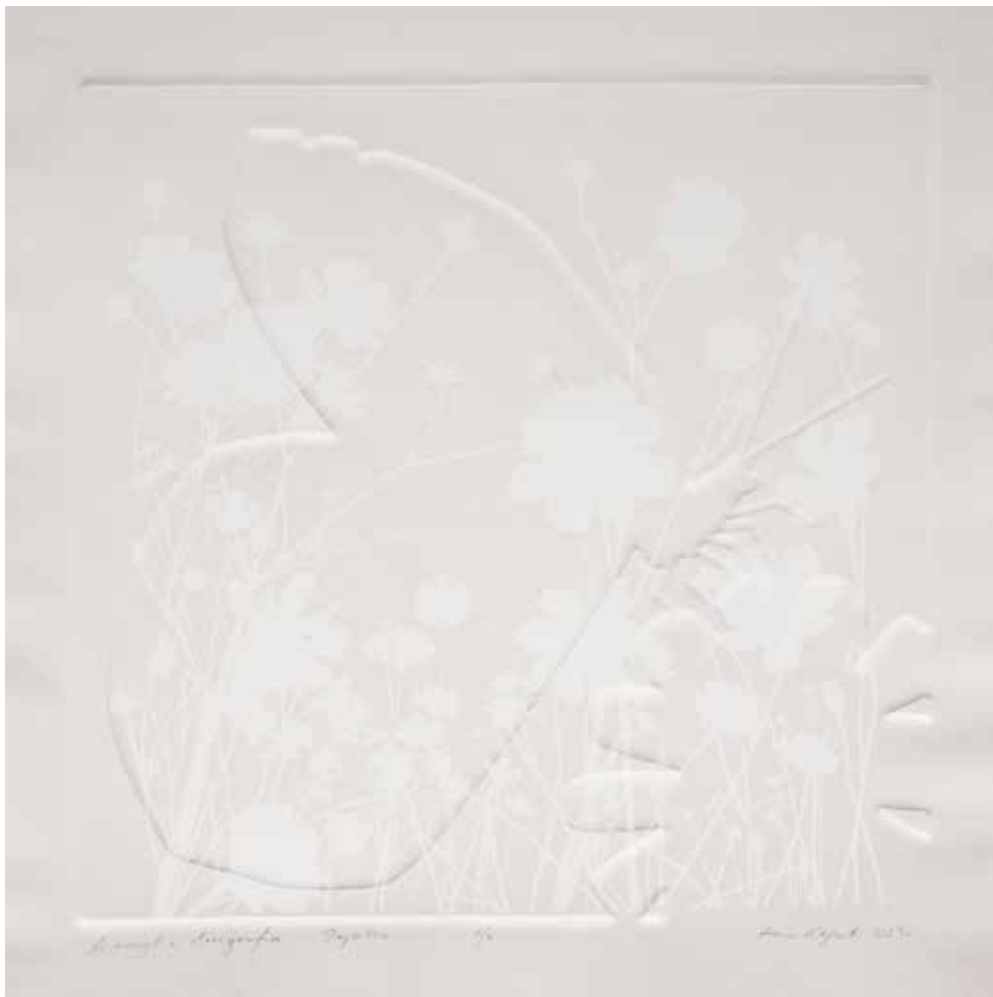
2023, Papillon , linoryt i serigrafia, 60 x 60 cm