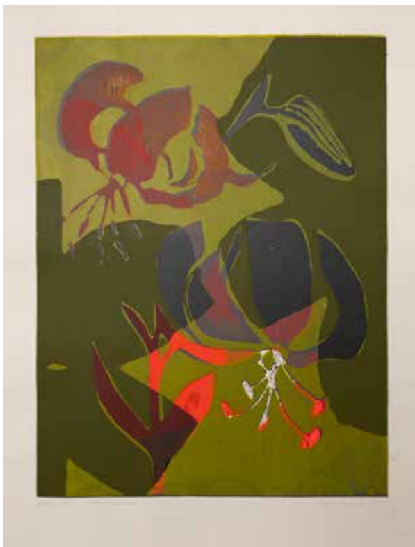
2022, Ukontowanie , serigrafia, 66 x 50 cm