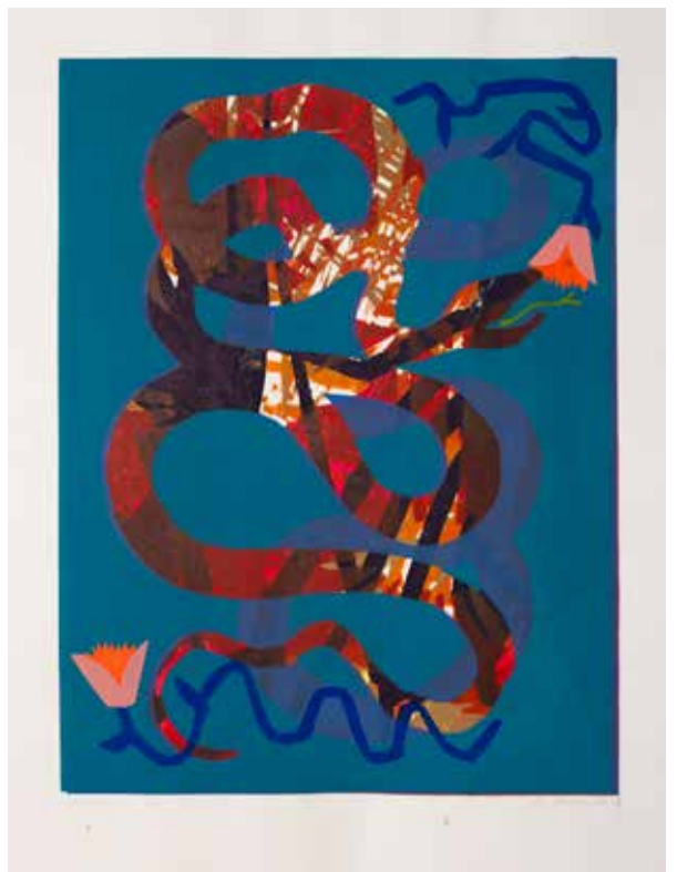
2023, Raj , serigrafia, 66 x 50 cm