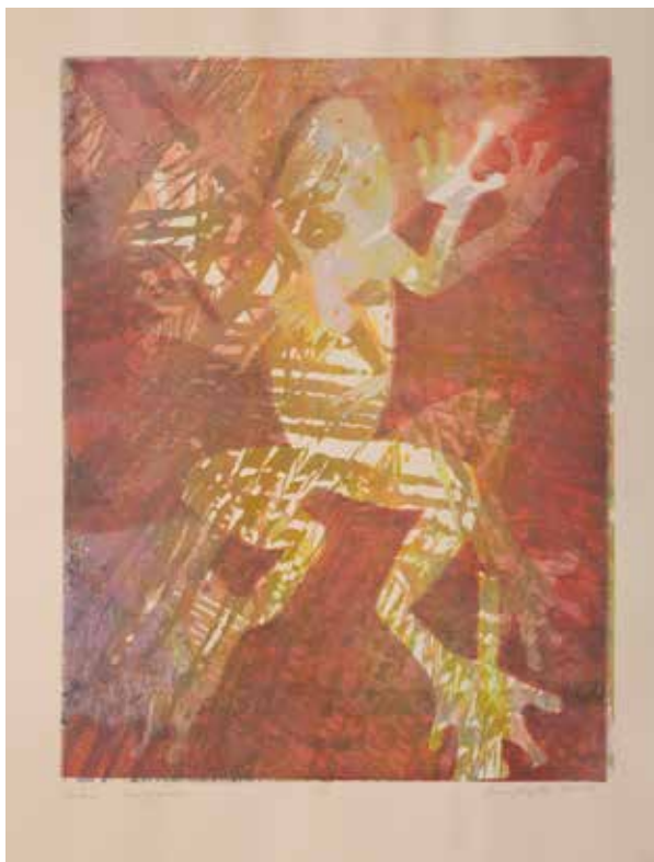
2023, Žaba , serigrafia, 66 x 50 cm