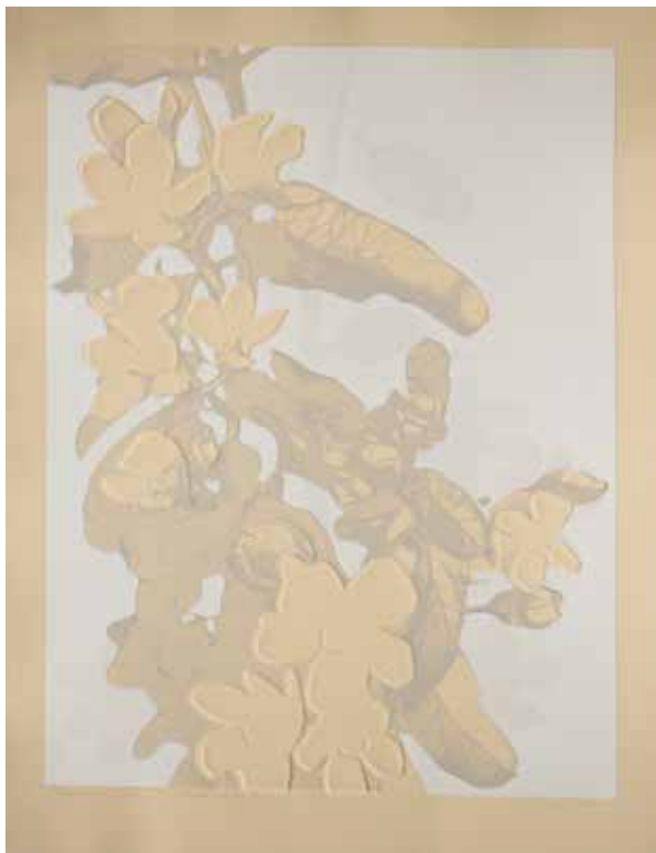
2020, Ulotna doskonałość , z cyklu Ulotna doskonałość , serigrafia i linoryt, 66 x 50 cm