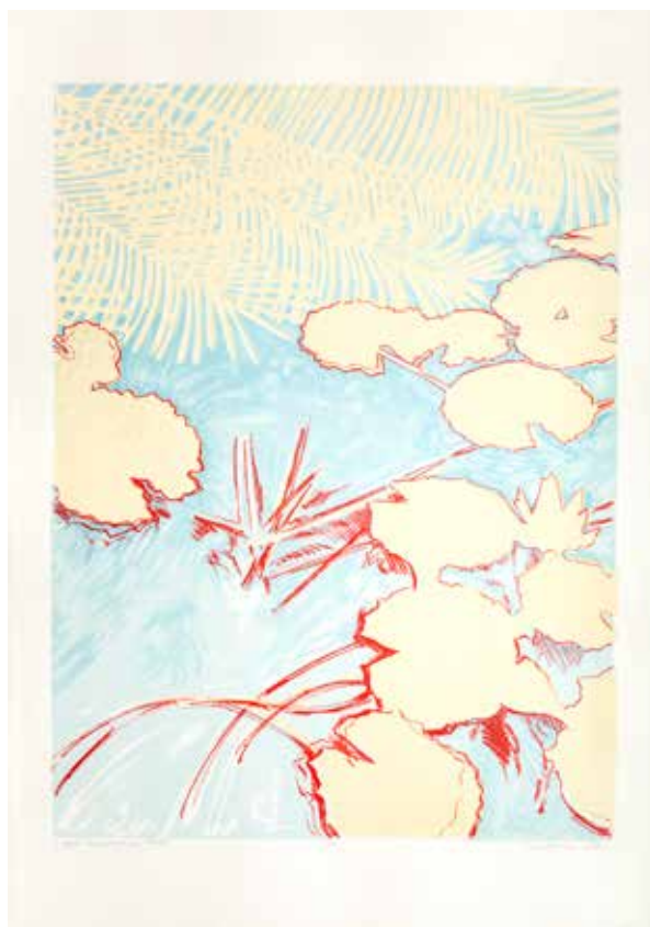
2018, Iluzja , z cyklu Fantasmagoria , serigrafia, 66 x 50 cm