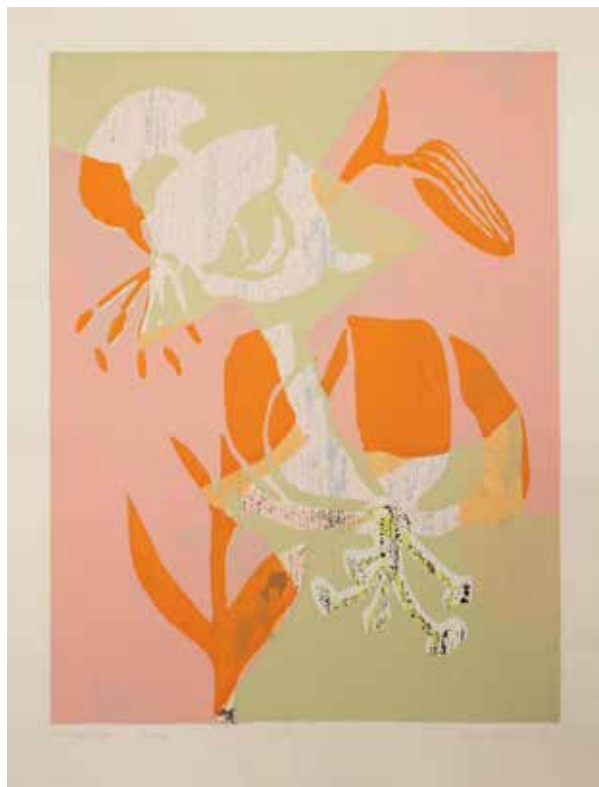
2022, Ukontowanie , serigrafia, 66 x 50 cm