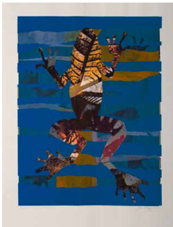
2023, Žaba , serigrafia, 66 x 50 cm