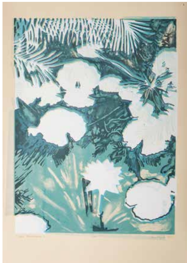
2018, Fantasmagoria 2 , z cyklu Fantasmagoria , serigrafia, 66 x 50 cm