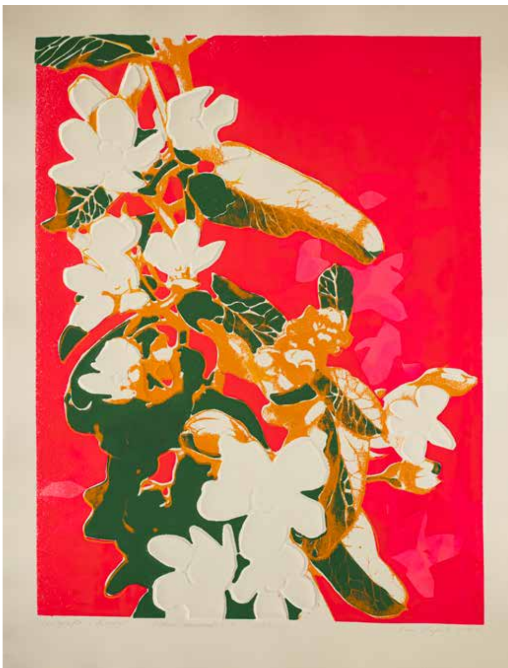
2020, Ulotna doskonałość 2 , z cyklu Ulotna doskonałość , serigrafia i linoryt, 66 x 50 cm