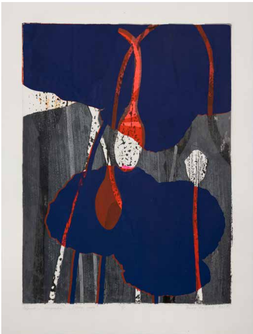
2021, Istota życia , odprysk i serigrafia, 66 x 50 cm