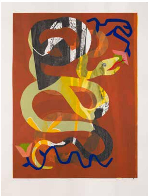
2023, Raj , serigrafia, 66 x 50 cm