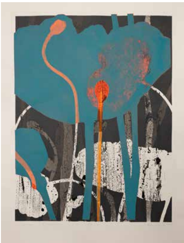
2022, Wypełnienie , serigrafia, 66 x 50 cm