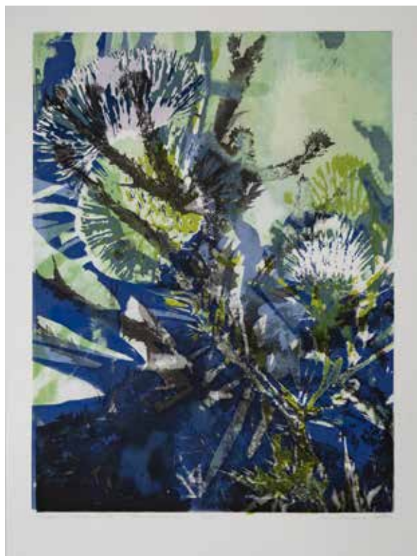
2019, Nawarstwianie czasu , serigrafia i odprysk, 66 x 50 cm