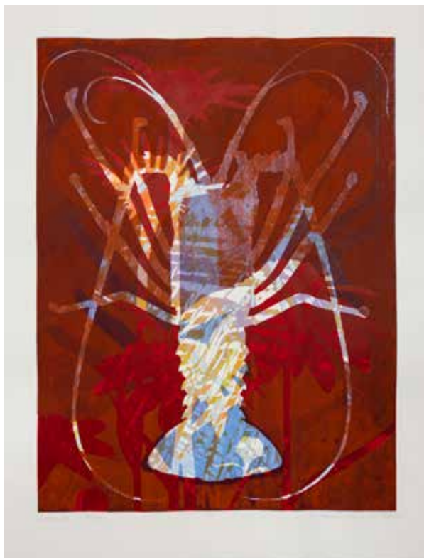
2021, Poryw , serigrafia, 66 x 50 cm