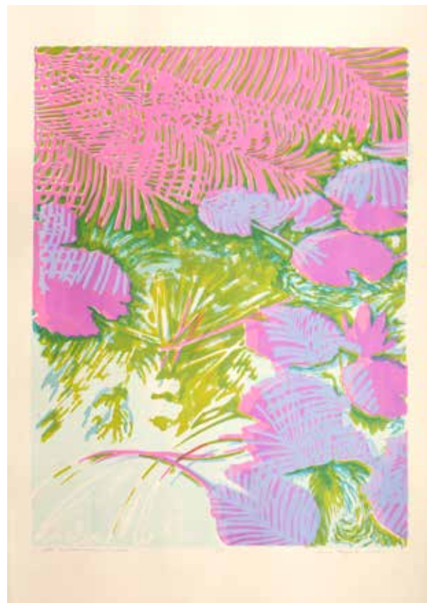
2018, Irrealizm , z cyklu Fantasmagoria , serigrafia, 66 x 50 cm