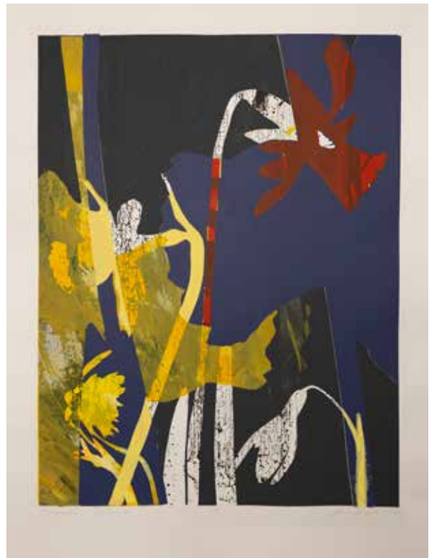
2022, Eutymia , serigrafia, 66 x 50 cm