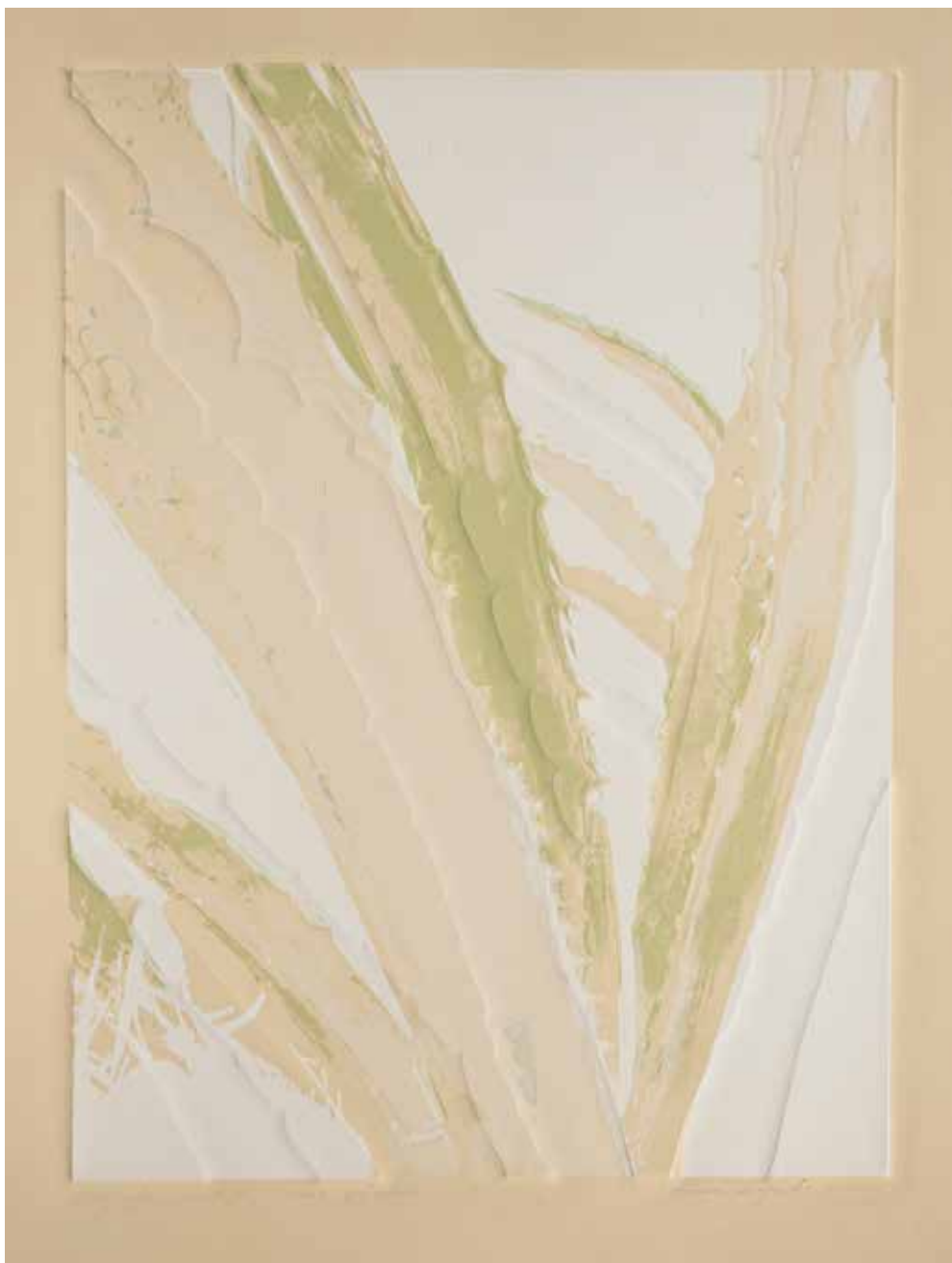
2020, Inne spojrzenie , serigrafia i linoryt, 66 x 50 cm