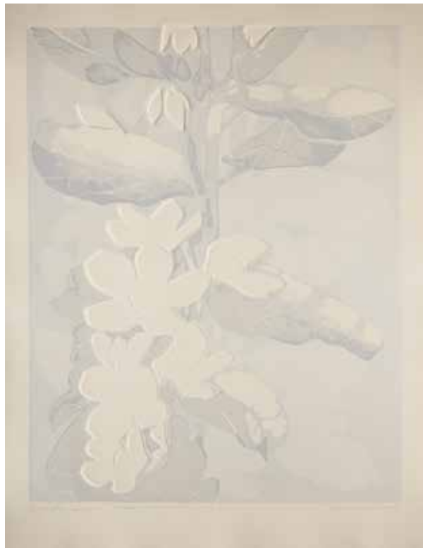
2020, Ulotna doskonałość , z cyklu Ulotna doskonałość , serigrafia i linoryt, 66 x 50 cm