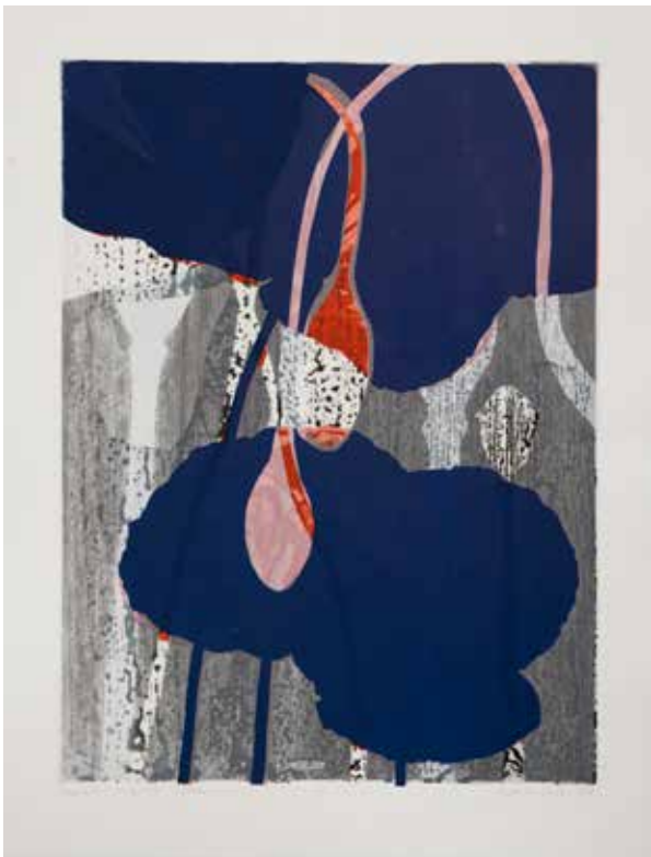
2021, Istota życia , odprysk i serigrafia, 66 x 50 cm