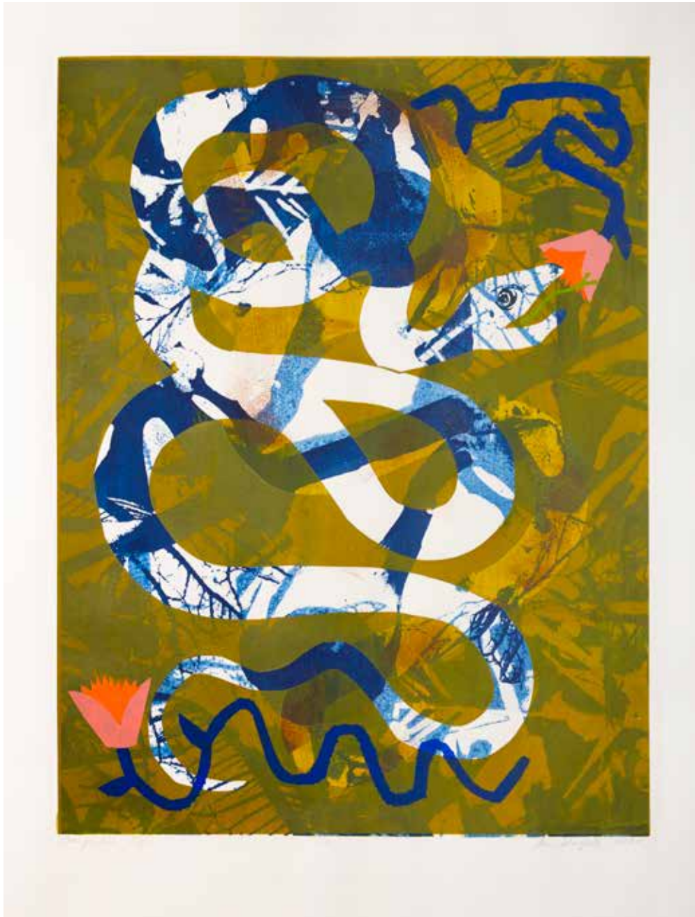
2023, Raj , serigrafia, 66 x 50 cm