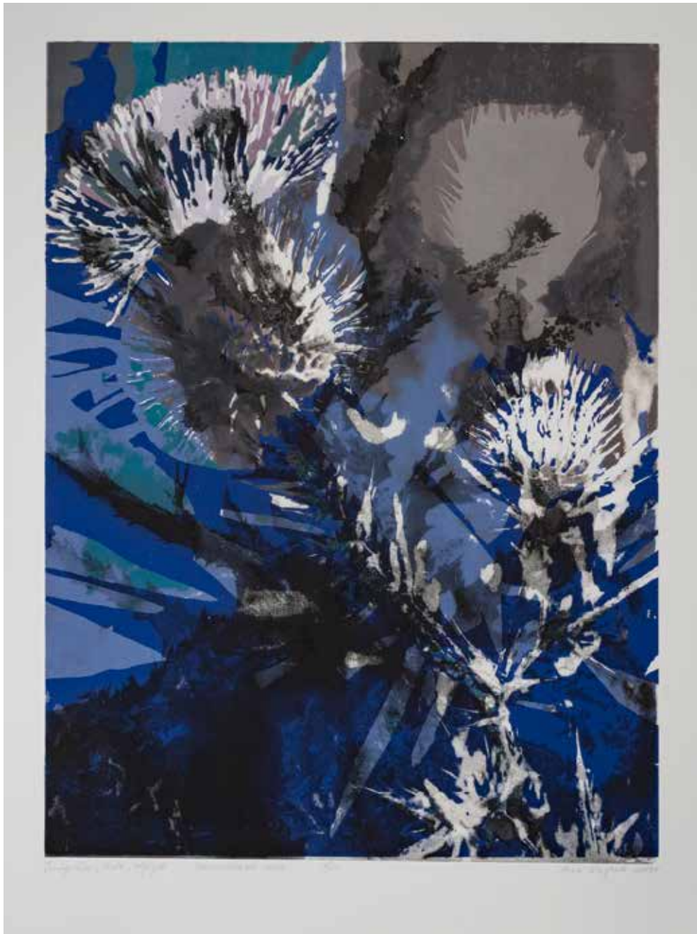
2019, Przemijanie , serigrafia i odprysk, 66 x 50 cm