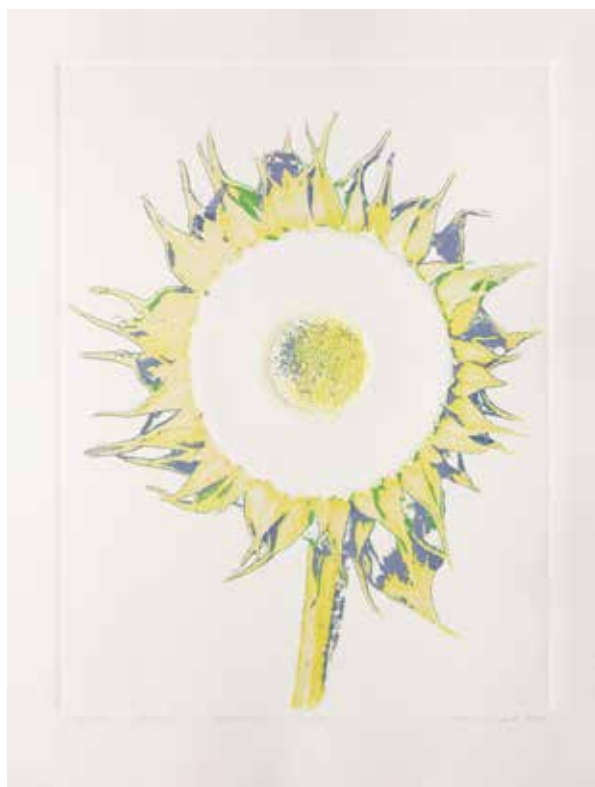
2023, Wygasanie , linoryt i serigrafia, 66 x 50 cm