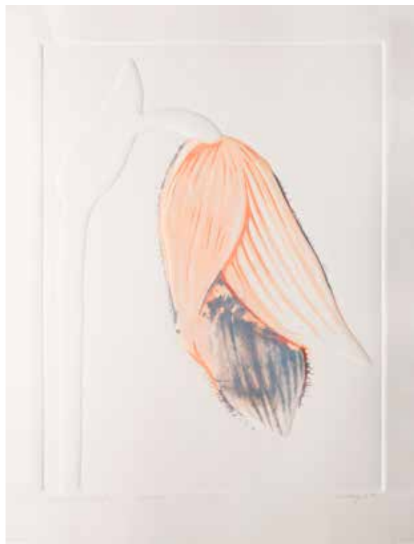
2023, Wygasanie , linoryt i serigrafia, 66 x 50 cm