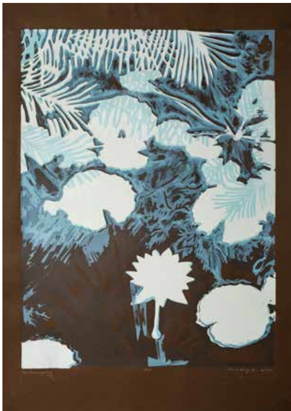
2018, z cyklu Fantasmagoria , serigrafia, 66 x 50 cm