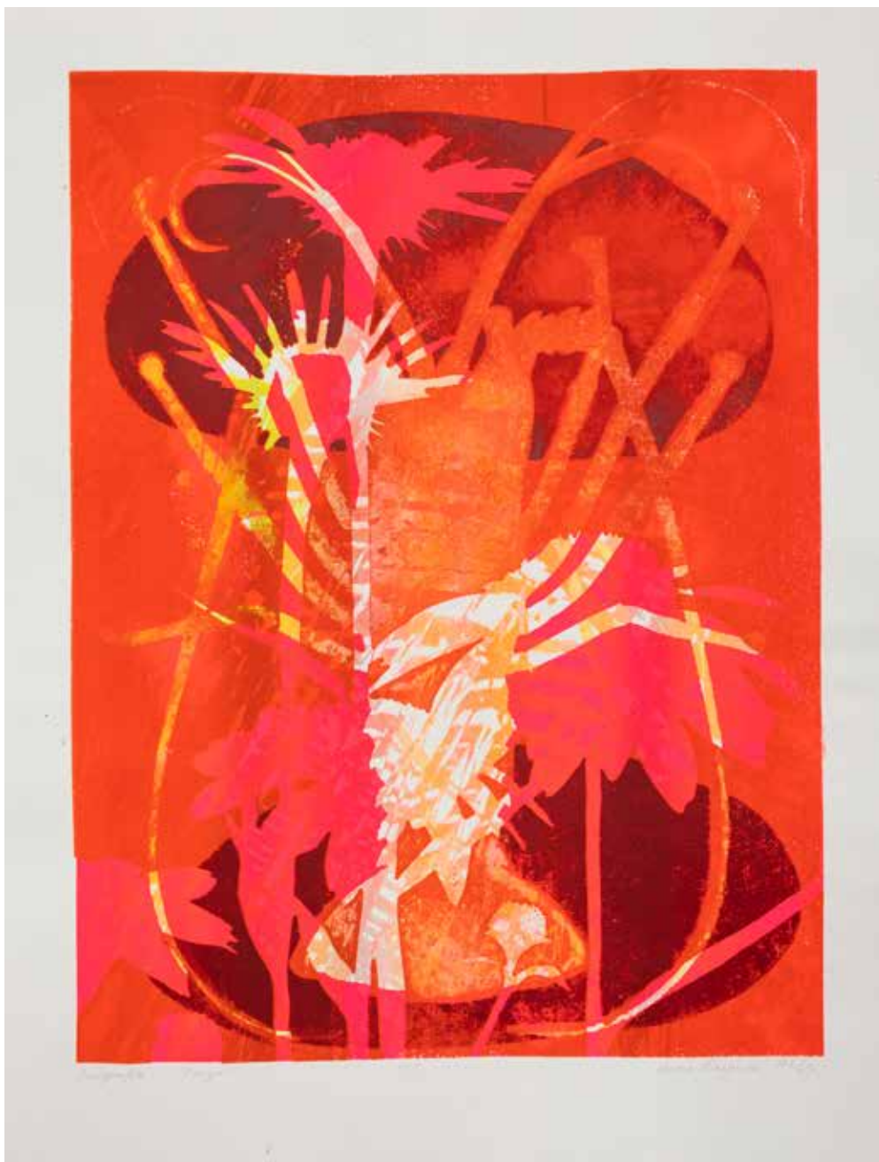
2021, Poryw , serigrafia, 66 x 50 cm