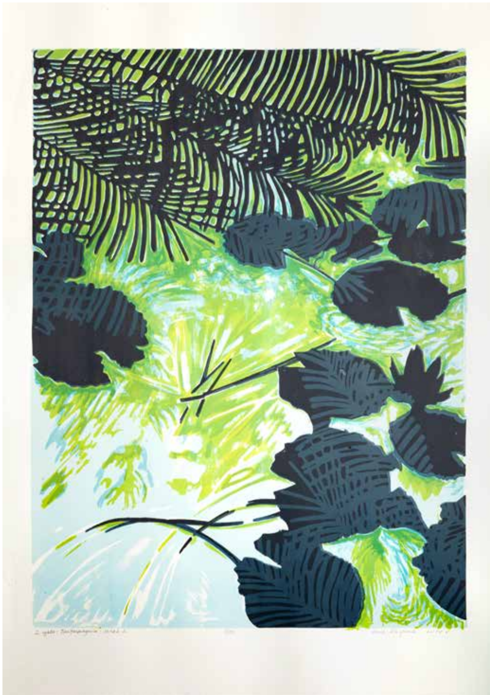
2018, Miraż 1 , z cyklu Fantasmagoria , serigrafia, 66 x 50 cm