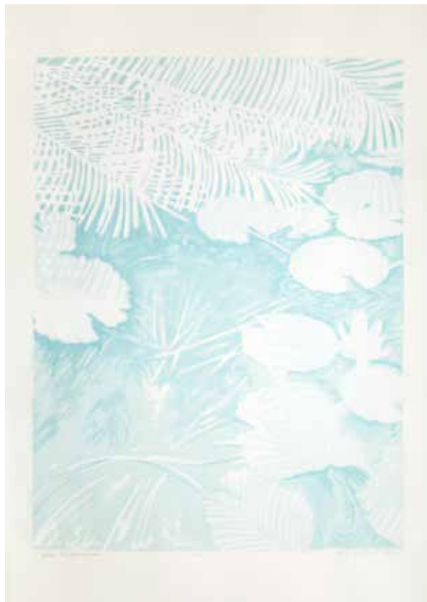
2018, z cyklu Fantasmagoria , serigrafia, 66 x 50 cm