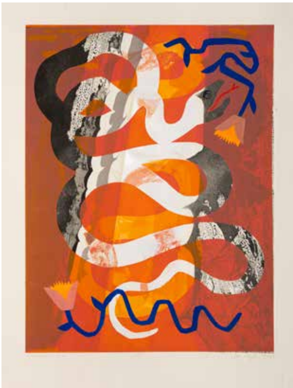
2023, Raj , serigrafia, 66 x 50 cm